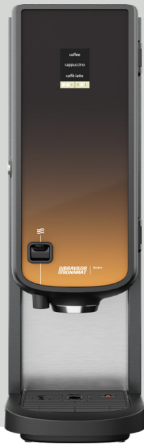
Bolero 21 met heetwateraftap