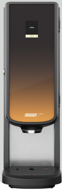
Bolero 11 zonder heetwateraftap